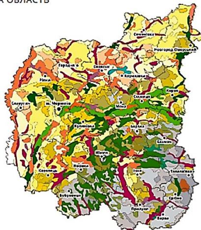
Рис. 1. Ґрунти Чернігівської області. 1