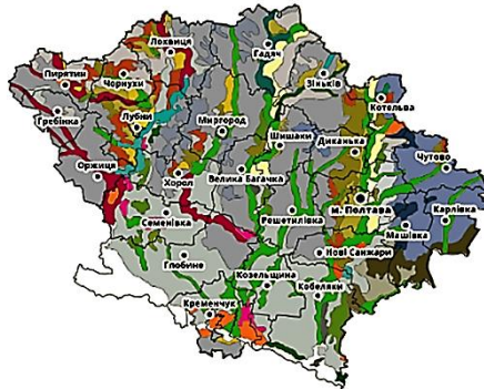
Рис. 3. Ґрунти Полтавської області. 3

стей. Ці області відзначено на карті темно-сірим кольором і позначено як «чорноземи, глинисті».