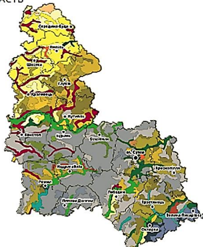
Рис. 2. Ґрунти Сумської області. 2