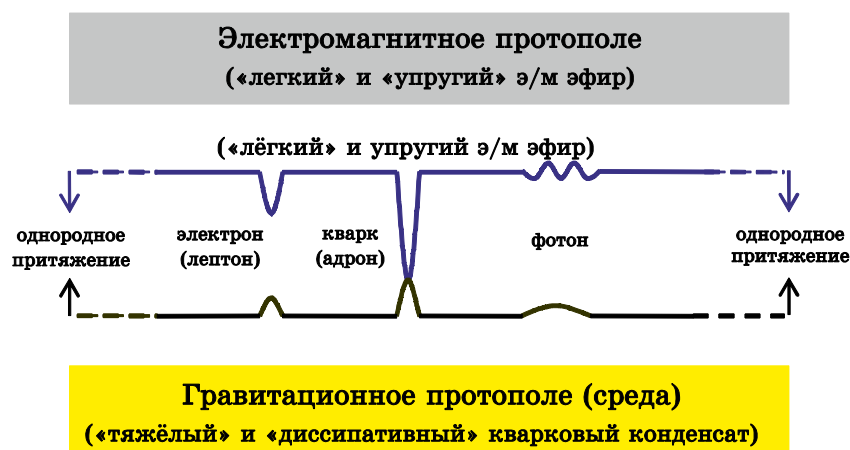
Рис. 1. Схема конфигурации и развития нередуцированного взаимодействия протополей, приводящего к динамическому возникновению (последовательно выводимых) элементарных частиц, полей, их свойств и взаимодействий.

«Фундаментальные» структуры мира наиминимальной сложности возникают неизбежно из наипростейшей возможной конфигурации взаимодействия, которая уникально представлена, в масштабе вселенной, двумя однородными, физически реальными протополями, равномерно притягивающимися друг к другу (рис. 1). Плотное и диссипативное гравитационное протополе (или среда) играет роль инертной «матрицы» мира и, в конечном счёте, служит источником (динамически возникающей) универсальной гравитации. Тогда как лёгкое и эластичное электромагнитное (э/м) протополе является «быстрой» компонентой системы, определяющей э/м-свойства. Развитие взаимодействия в системе протополей приводит, прежде всего, к возникновению наиболее фундаментальных структур мира, элементарных частиц (и полей). И мы собираемся получить их в явном виде как нередуцированные решения уравнения довольно общего вида, называемого уравнением существования , и фактически лишь описывающего начальную конфигурацию системы (оно также обобщает различные «модельные» уравнения):