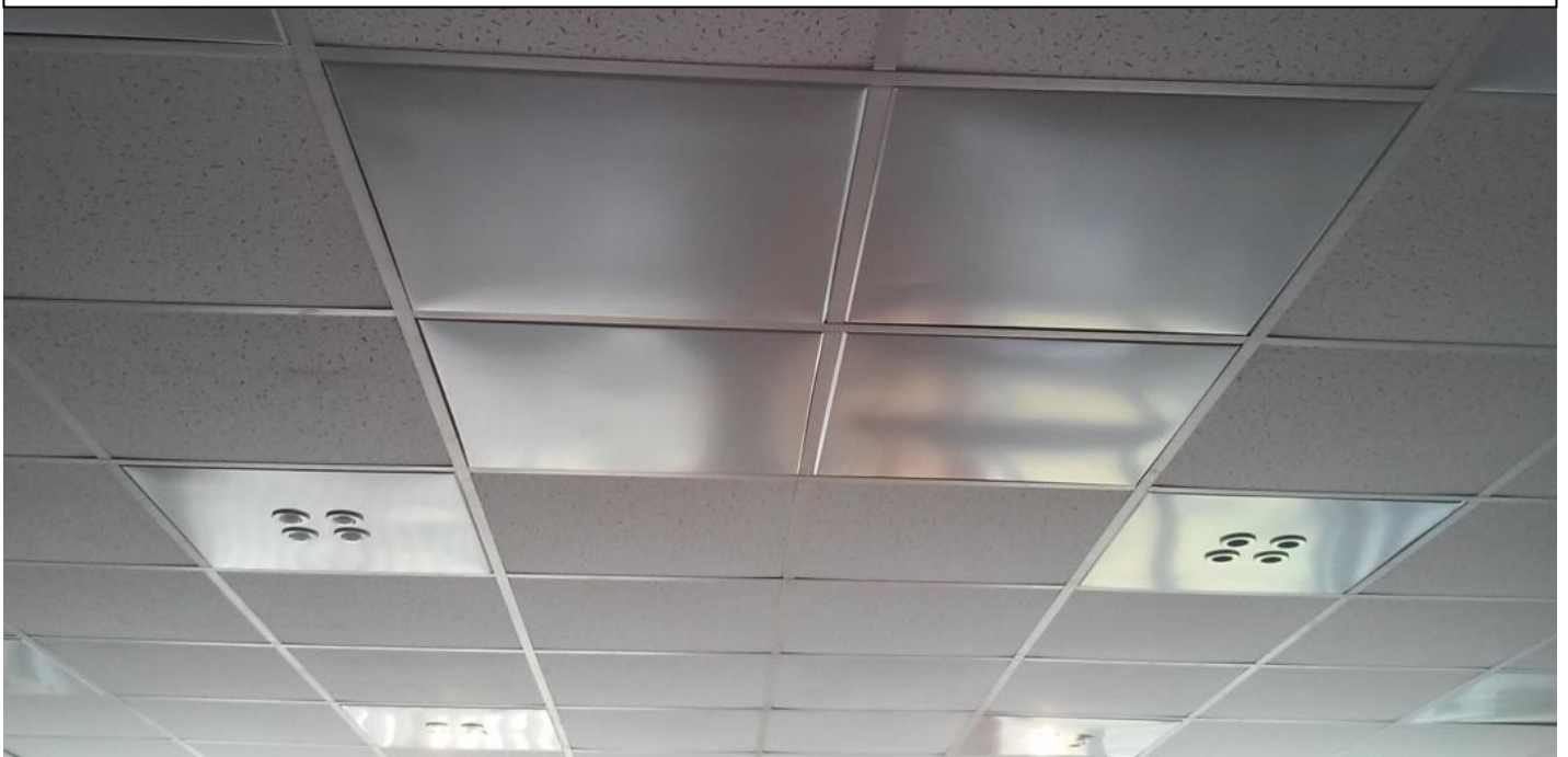
Квадратні плівкові нагрівачі, змонтовані на підвісній стелі

Універсальність плівкових нагрівачів з аморфної стрічки ХКБРС відкриває широкі можливості для їх використання під час основного або додаткового (зонального) обігріву приміщень і передбачає застосування при різних типах і в різних місцях монтажу – від систем «тепла підлога» до стельових систем інфрачервоного опалення. Низька робоча температура нагрівача запобігає випалюванню кисню з повітря опалюваного приміщення. Крім того, на відміну від інших електричних нагрівальних приладів, плівкові нагрівачі є вологостійкими й